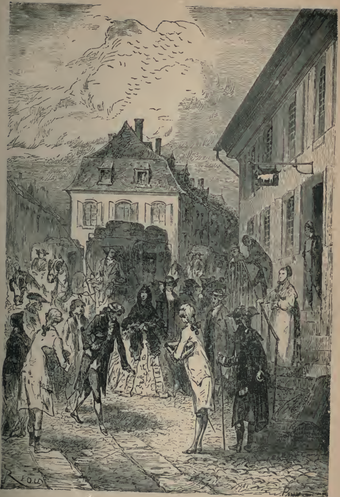
CES GENS SE SALUAIENT GRAVEMENT. (PAGE 17.)